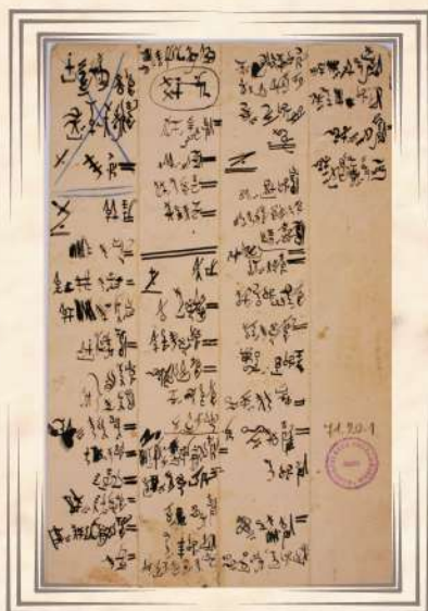
Gárdonyi titkosírásos ábécéje